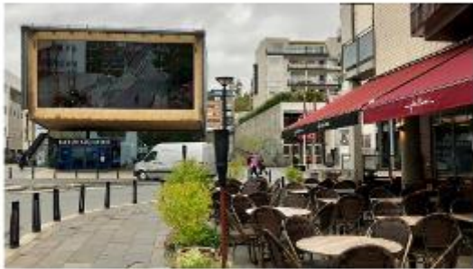
Bærum kulturhus.

23. - 24. januar 2019 arrangerer Kulturrådet, Forskningsrådet, Diku, BufDir, NOKU, Nordisk informasjonskontor Norge og Akershus fylkeskommune konferansen Kultur over grenser i Bærum kulturhus. Her er programmet. Påmeldingsfristen har nå gått ut. Vi ønsker velkommen til konferansen!